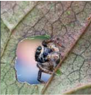
Carrhotus xanthogramma (Salticidae) nous observe du bord de sa fenêtre végétale.