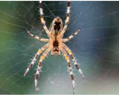
Gros plan sur la morphologie externe d'une Araneus diadematus (Araneidae) en face ventrale. Le scape, petite excroissance de l'épigyne, organe sexuel externe de la femelle permettant de différencier les espèces, est nettement visible.