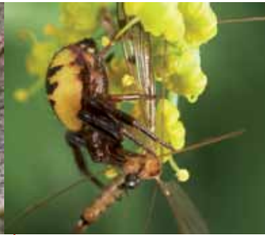
Synema globosum (Thomisidae) chasse à l'affût, généralement sur des fleurs jaunes ou rouges, saisissant ses proies d'un bond pour les mordre rapidement, comme cette tipule.

ISBN 978-2-7592-2227-8 128 pages couleurs Coll. Beaux livres Quæ, 2014 Réf. 02449 - Prix : 23 €